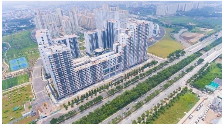
Công trình khu chung cư cao cấp NEW CITY Q2 (Thuận Việt)