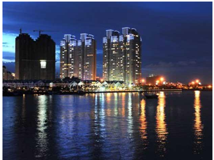
Chung cư Sài Gòn Pearl (Bình Thạnh)