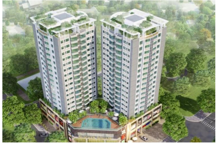
Chung cư Summer Square (Gotec land)