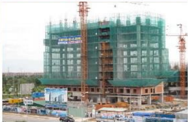
Cao ốc Aroma và khu biệt thự Sunflower