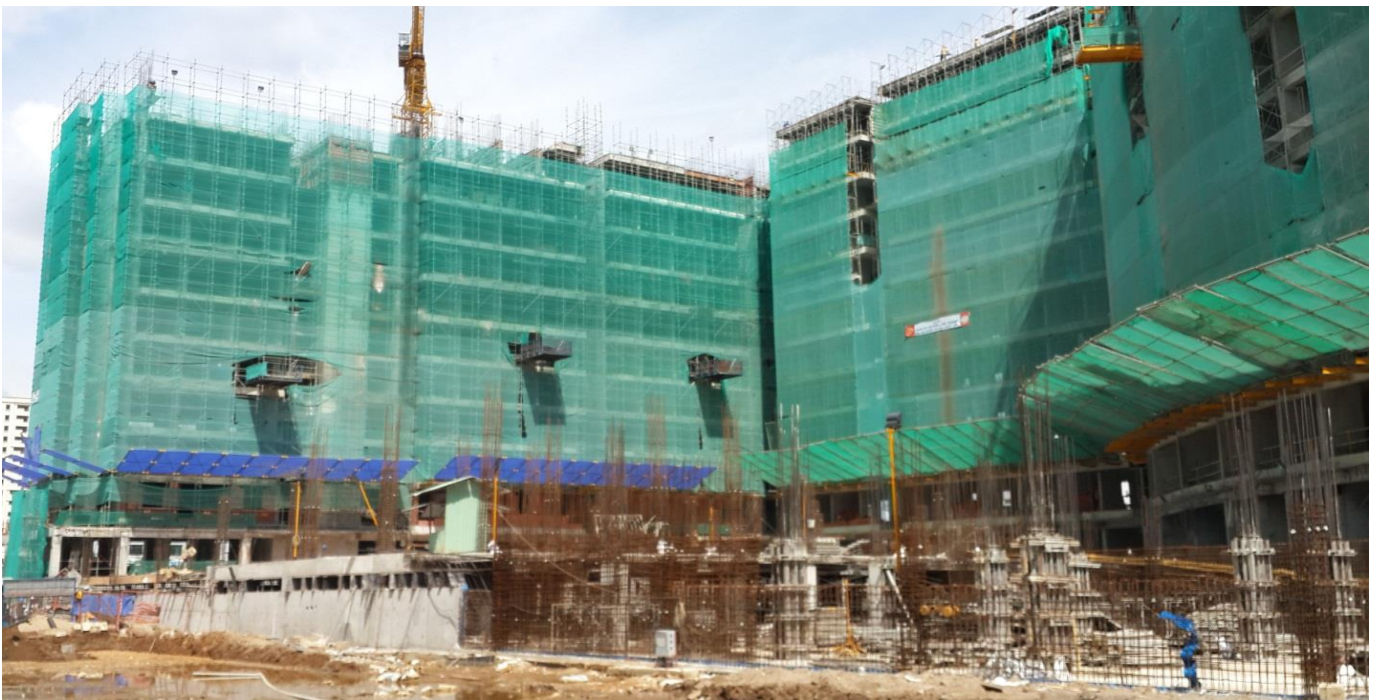
Công trình 2.220 căn hộ Bình khánh Q.2. TP HCM