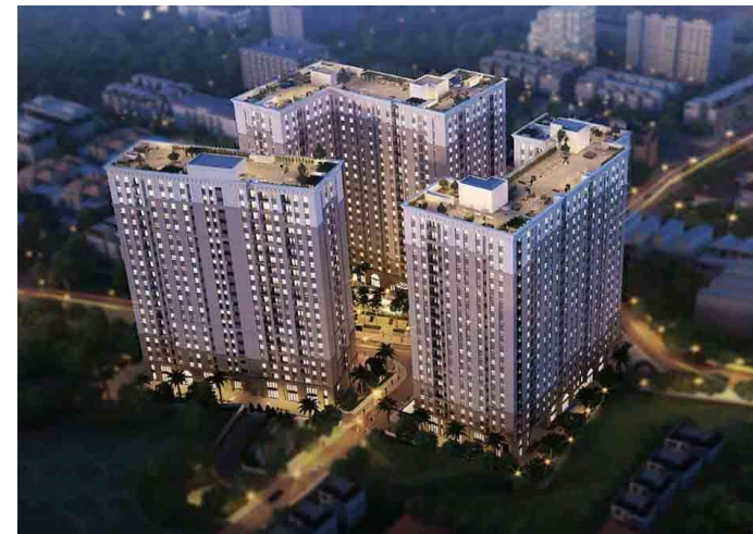
Chung cư thương mại và tái định cư IMPERIAL PLACE (Bình Tân)