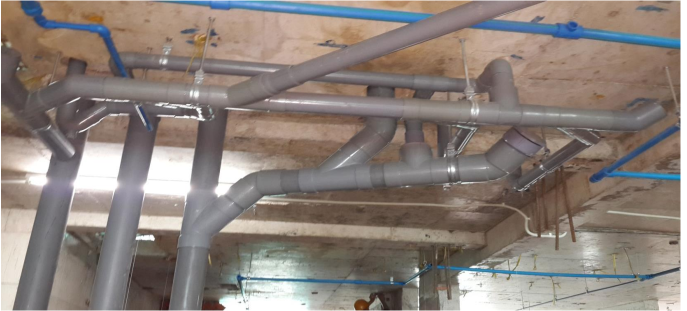
Hình ảnh đang thi công công trình 1.330 căn hộ quận 2 và Becamex Bình Dương